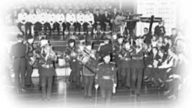
The 1st Pool Billiard World Championship 1990 in Bergheim