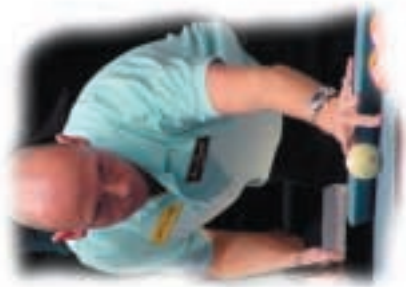
Ralf Souquet, GER